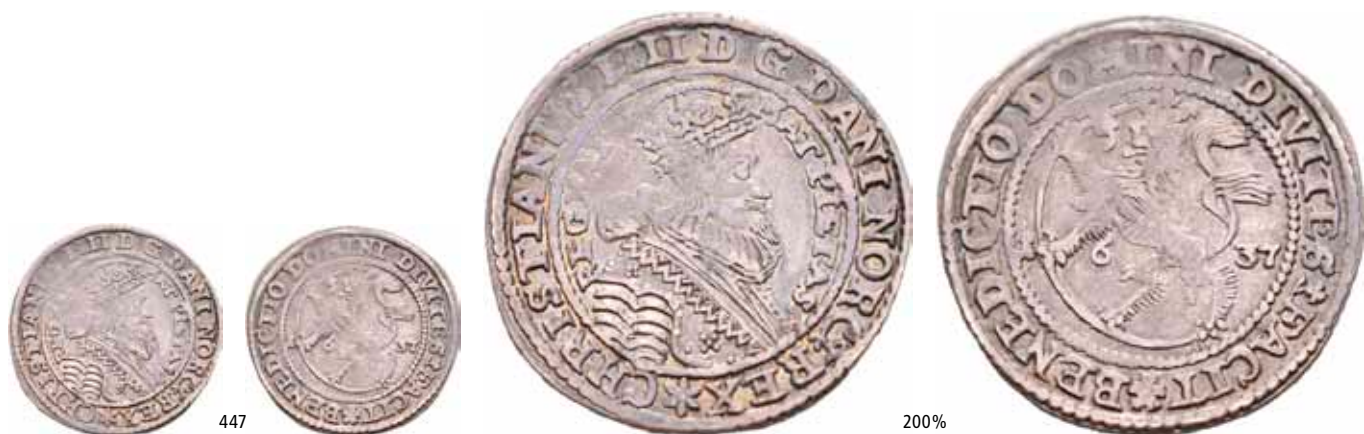
447 1/4 speciedaler 1637. S.7 Ex. Oslo Mynthandel a/s nr.33 26/3-1994 nr.353