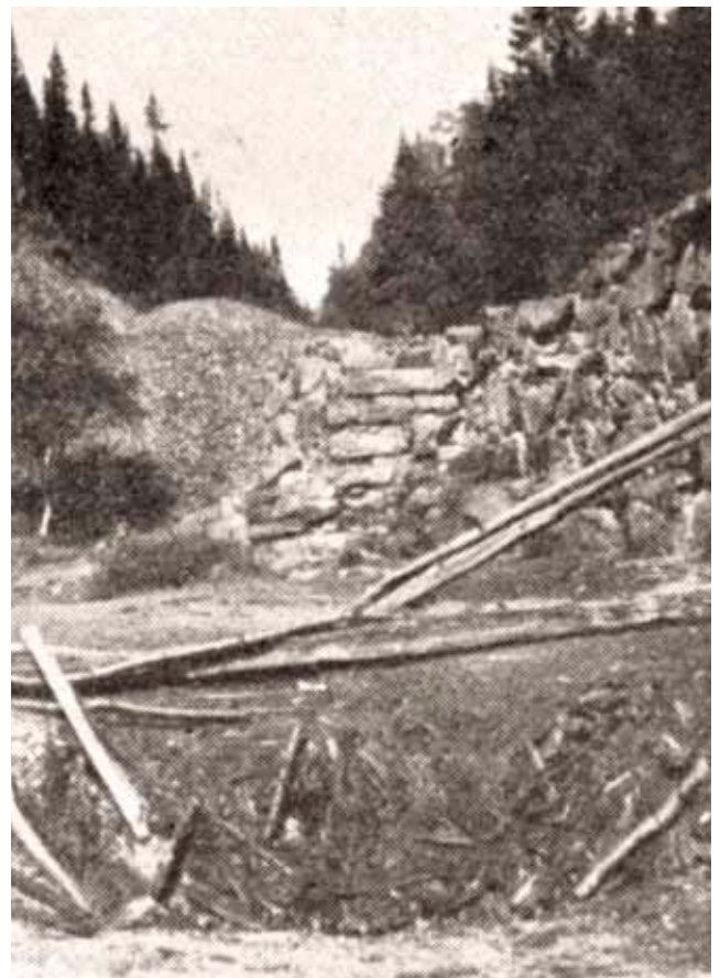
Til venstre: Kartskisse over Guldnes gruver i Seljord, hvor sølvet til Gimsøymyntene kommer fra. Til høyre: Bilde av gruvedrift.