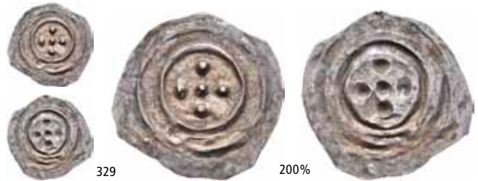
Schive VII:54 NM.20 1+ 6 000