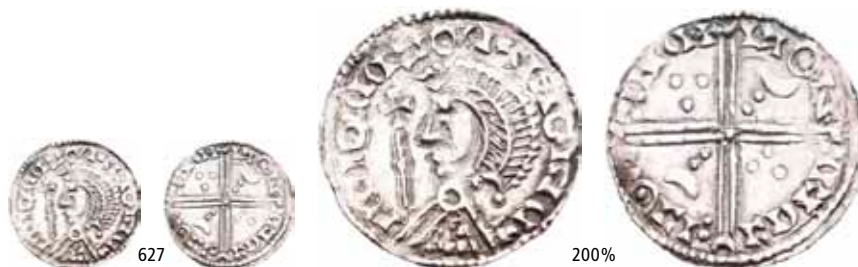
627 Penning, Viborg. Long cross. (0,79 g)

Ex. Bruun Rasmussen nr.142 9/4-1962 nr.11 (Ove Meyer)