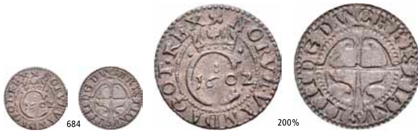
684 Hvid 1602. S.16