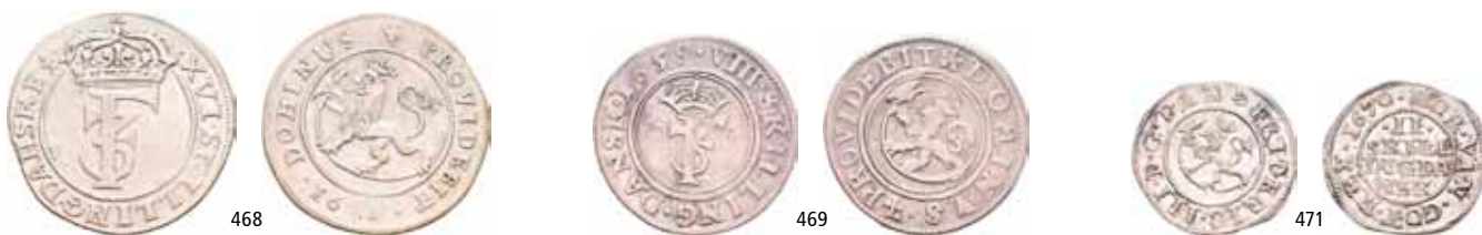
468 1 mark 1665. S.50 NMD.186 H.68I 1+ 7 000 469 8 skilling 1659. S.89 NMD.201 H.69C 1 5 000 Ex. Oslo Mynthandel a/s nr.55 16/4-2005 nr.201 470 Lot 3 stk. 2 skilling 1654, 1667 og 1670 (Christian V.) NMD.213,226, 138 H.70E,70B, 70E 1,1-,1+ 1 000 471 2 skilling 1670. S.9 NMD.231 H.70E 01 2 000 472 Lot 2 stk. 1 skilling 1651 og 1667, S.63 og S.160 NMD.234,250 H.71B,H.71C 1/1+, 1 1 200