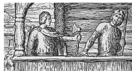
Magnus den gode. Illustrasjon av Halfdan Egedius.

624 Penning, Lund. Myntmester Ardl. (0,78 g) Hbg.1 1+/01 4 000 Ex. Oslo Mynthandel a/s nr.45 1/4-2000 nr.483