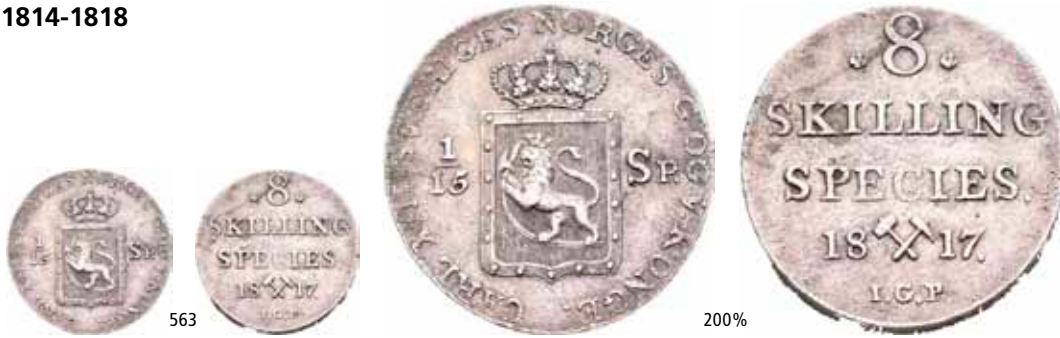
563 8 skilling 1817