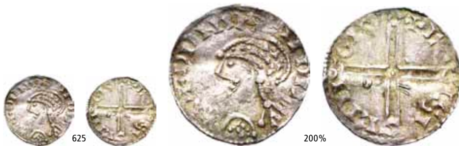
625 Penning, Lund. Long cross. Buklet/creased. (0,98 g)