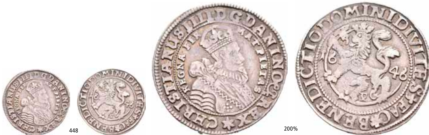
448 1/4 speciedaler 1646. S.45