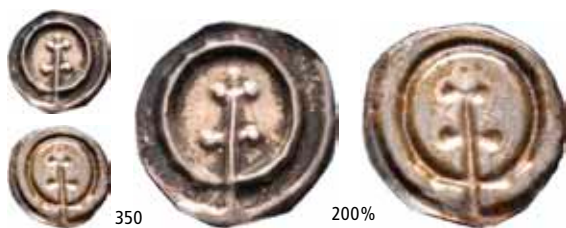
350 Brakteat med patriarkalkors (0,14 g)