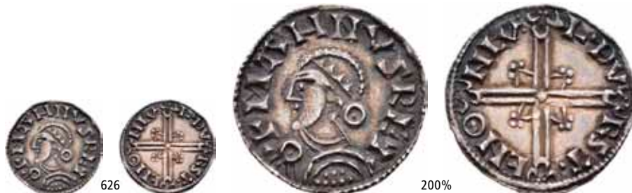
626 Penning, Lund. Long cross. (1,07 g)