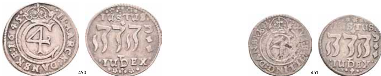
450 2 mark 1645. S.41

Ex. Walt Jellum og Oslo Mynthandel a/s nr.55 16/4-2005 nr.163