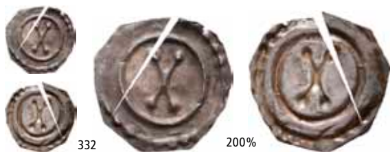
332 Brakteat med bokstaven X (0,07 g) Nesten brukket i to/almost broken in two parts