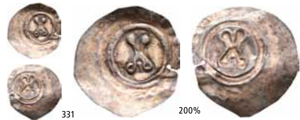
Schive VII:121 NM.21 01 6 000