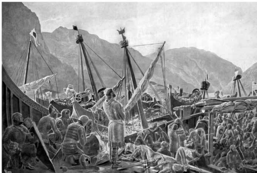
Kong Sverre ber takkebønn etter slaget ved Fimreite. Illustrasjon av Andreas Bloch

Se forøvrig Simensen, NNF-nytt nr.1-2/1995 s.18-27 «Hvem preget mynter i kong Sverres tid 1177-1202»