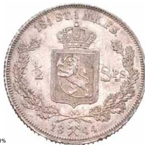
570 1/2 speciedaler 1844 NM.29 01 6 000