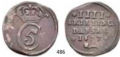
486 4 skilling 1677. S.28