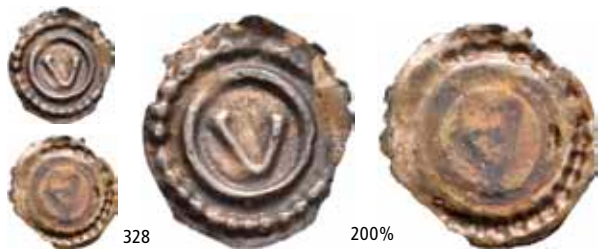
328 Brakteat med bokstaven V (0,06 g) Ex. Olav Kirkevoll og Oslo Mynthandel a/s nr.37 2/3-1996 nr.185