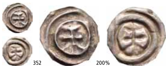
352 Brakteat med patriarkalkors (0,06 g)

Ex. Oslo Mynthandel a/s nr.30 6/11-1992 nr.575