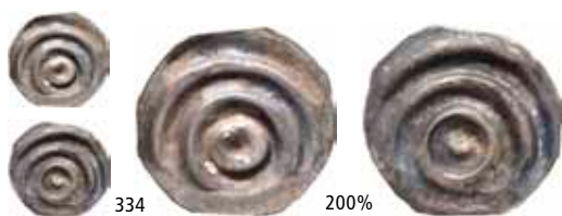
334 Brakteat med punkt (0,04 g) Ex. Oslo Mynthandel a/s nr.30 6/11-1992 nr.572