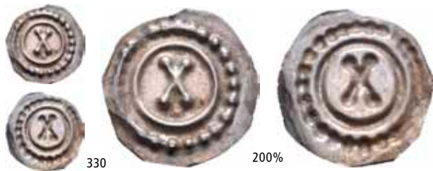
330 Brakteat med bokstaven X (0,08 g) Ex. Oslo Mynthandel a/s nr.34 7/10-1994 nr.256