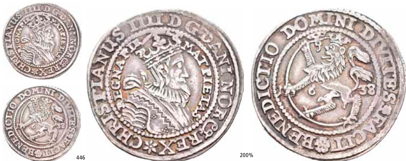
446 1/2 speciedaler 1638. R. S.4 Ex. Oslo Mynthandel a/s nr.33 26/3-1994 nr.350

NMD.27B H.1 1+ 35 000 NMD.34A H.5A 1+ 22 000