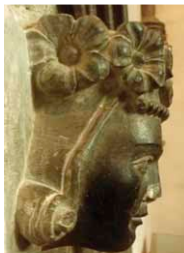
Portrett av Håkon V Magnusson med hertugkrone i form av rosekrans i Stavanger domkirkes kor.

392 Penning ca.1299-1307 (1,05 g) Ex. Oslo Mynthandel a/s nr.32 29/10-1993 nr.300