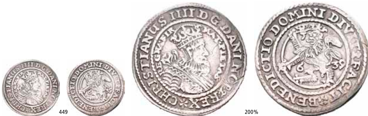
449 1/8 speciedaler 1639. S.7