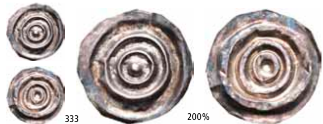
Schive VII:121 NM.21 1+ 1 000