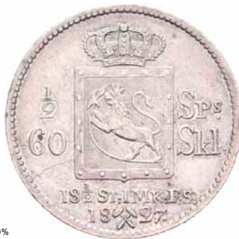
569 1/2 speciedaler 1827 NM.20A 1+/01 7 000