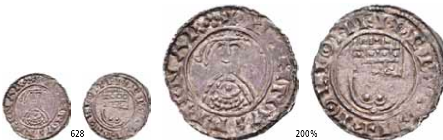
628 Penning, Hedeby, mm. IVLE (0,71 g). R.