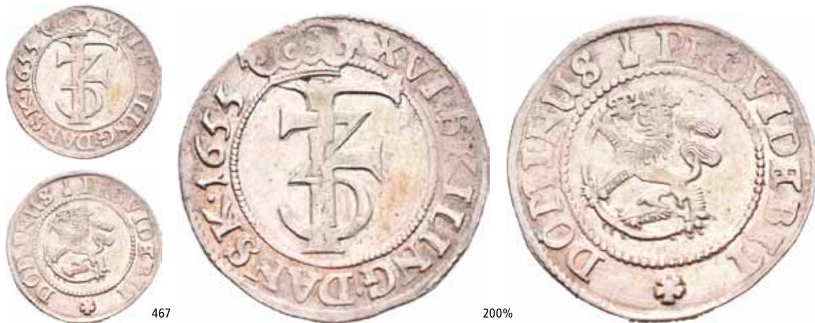
467 1 mark 1655. S.40 NMD.177 H.68C 1+ 4 000