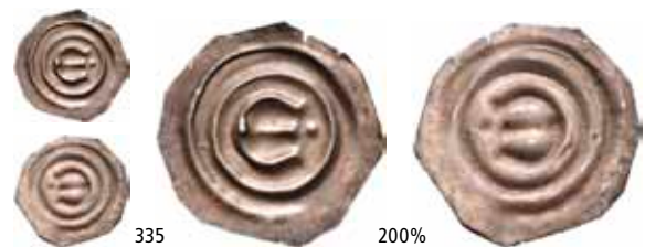
Schive VIII:7 NM.25 1+ 5 000