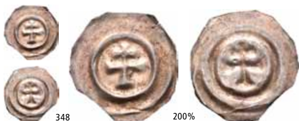
348 Brakteat med patriarkalkors (0,06 g)

Ex. Oslo Mynthandel a/s nr.25 9/11-1990 nr.292