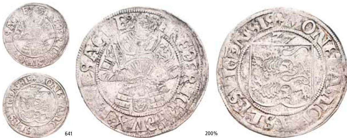
641 Dobbeltskilling 1527, Gottorp G.124B 1+ 1 200 Ex. Oslo Mynthandel a/s nr.43 17/4-1999 nr.1122