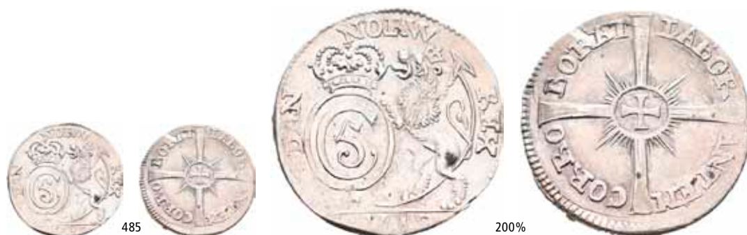
485 8 skilling 1685. S.17 NMD.135 H.61 01 18 000 Ex. Oslo Mynthandel a/s nr.67 26/11-2011 nr.405

Husk at alle enkeltobjekter er avbildet på våre nettsider www.oslomyntgalleri.no