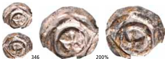
346 Brakteat med patriarkalkors (0,06 g). Kantskader/edge cracks