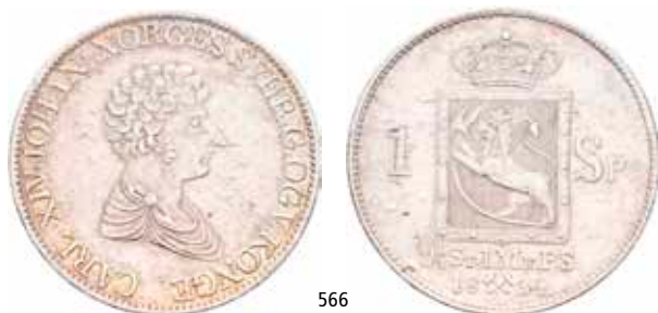
566 Speciedaler 1834

Ex. Oslo Mynthandel a/s nr.35 1/4.1995 nr.609