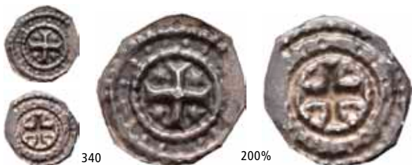
340 Brakteat med kors (0,15 g)