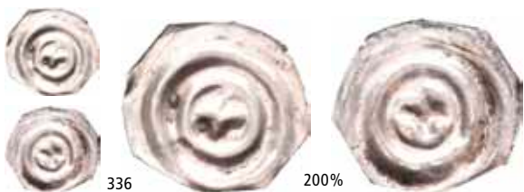
336 Brakteat med kors (0,07 g)