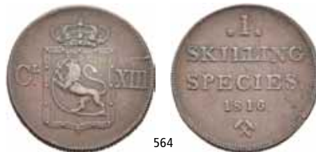
564 1 skilling 1816