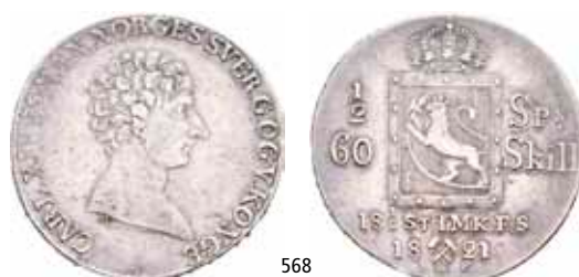
568 1/2 speciedaler 1821