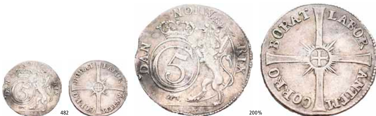
482 1 mark 1684. S.1c NMD.122 H.18 1/1+ 12 000 Ex. Oslo Mynthandel a/s nr.44 16/10-1999 nr.533 Et tiltalende eksemplar med et meget klart årstall.