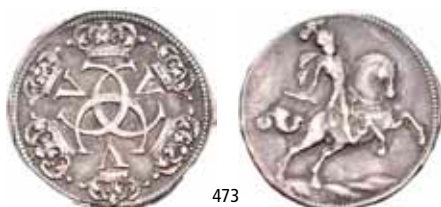
473 Solvavslag u.år/n.d. (7,17 g). S.5a NMD.24B H.20B 1+ 3 000 Ex. Oslo Myntgalleri a/s nr.1 20/10-2012 nr.473