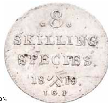
573 8 skilling 1819 NM.41A 01 2 500 Ex. Oslo Mynthandel a/s nr.44 16/10-1999 nr.630