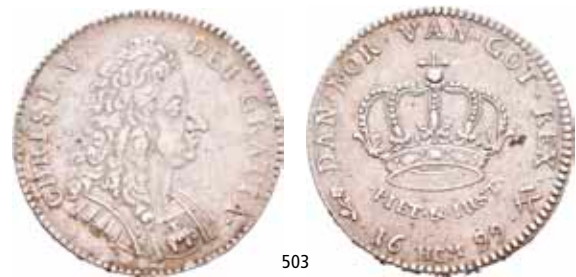
Ex. Oslo Mynthandel a/s nr.25 9/11-1990 nr.359