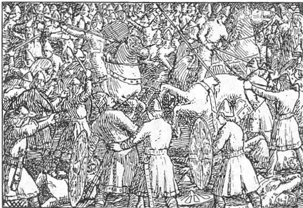
Harald Hardrådes fall under slaget ved Stamford Bridge i 1066. Illustrasjon av Wilhelm Wetlesen.