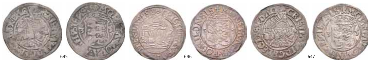
645 4 skilling 1535, Århus G.95B 1 500 646 4 skilling 1535, Roskilde G.99 1+ 1 500 647 4 skilling 1535, København G.104 1+ 1 800 Ex. Oslo Mynthandel a/s nr.35 1/4-1995 nr.1182

Husk at alle enkeltobjekter er avbildet på våre nettsider www.oslomyntgalleri.no