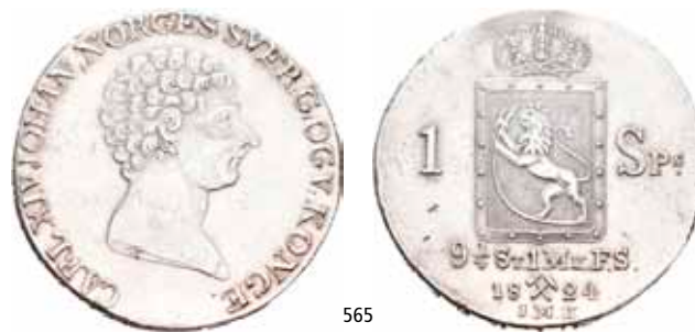
565 Speciedaler 1824

Ex. Oslo Mynthandel a/s nr.25 9/11-1990 nr.404