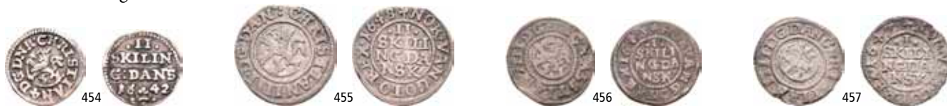
454 2 skilling 1642. S.48