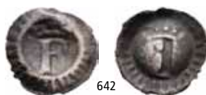
642 Blaffert u.år/n.d. Små kantkader/edge marks (0,43 g) G.79 1 400 643 Lot 5 stk. søsling (4), hvid (1) VK 800