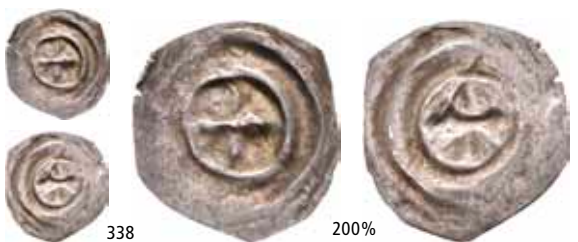
338 Brakteat med kors (0,08 g)

Ex. Kjøpt av Oslo Mynthandel a/s før 1985