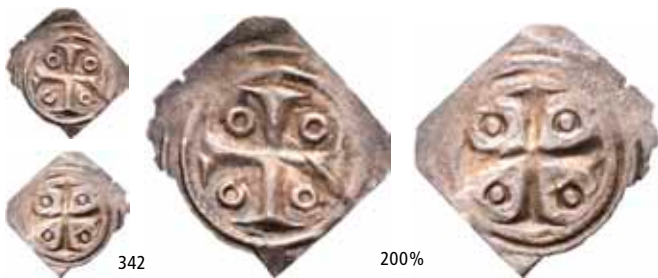
342 Brakteat med kors (0,12 g)