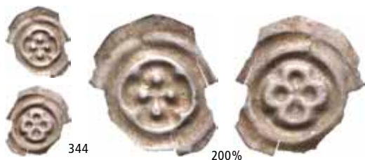
344 Brakteat med kors (0,03 g). Kantskader/edge cracks