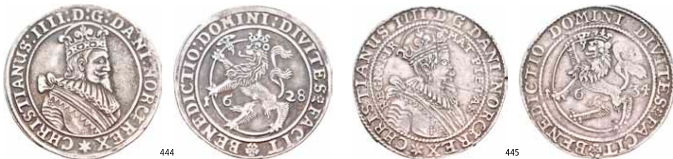
444 Speciedaler 1628. S.15 Ex. Oslo Mynthandel a/s nr.30 6/11-1992 nr.579 445 Speciedaler 1634. S.5 Ex. Oslo Mynthandel a/s nr.25 9/11-1990 nr.305

NMD.27B H.1 1+ 35 000 NMD.34A H.5A 1+ 22 000