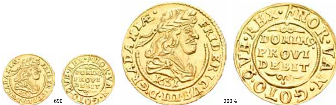
690 Dukat 1650. R. Svakt spor av montering/slight trace of mounting. S.1