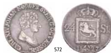
571 24 skilling 1819 NM.30A 1+ 1 200 Ex. Oslo Mynthandel a/s nr.35 1/4-1995 nr.620 572 24 skilling 1827 NM.34B 1/1+ 2 000 Ex. Oslo Myntgalleri a/s nr.1 20/10-2012 nr.608