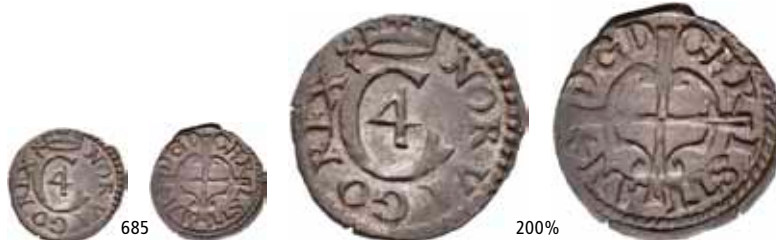
685 Hvid u.år /n.d. S.155