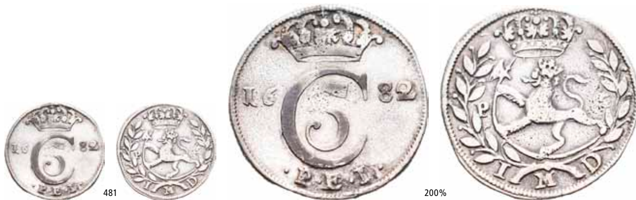
481 1 mark 1682. S.31 NMD.120 H.57B 1+ 15 000 Ex. Oslo Mynthandel a/s nr.56 19/11-2005 nr.459