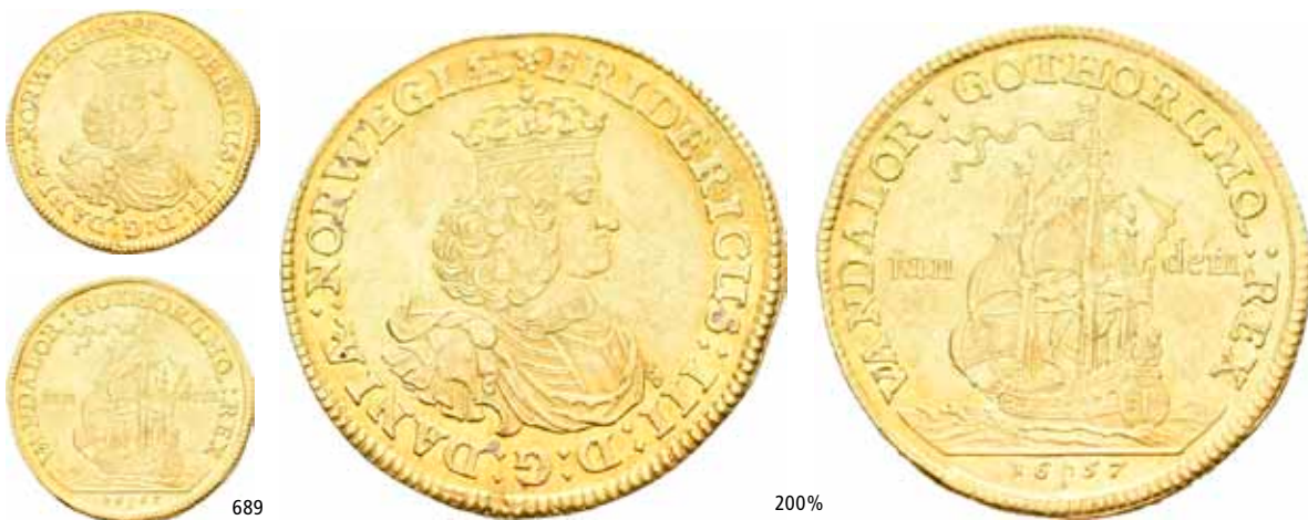
689 2 dukat 1657. Svakt spor av montering/slight trace of mounting. S.3